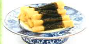
長久保のしそ巻き (長久保食品)