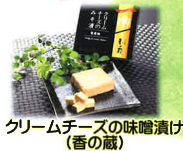
クリームチーズの味噌漬け (香の蔵)