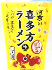
喜多方らーめん(河京)