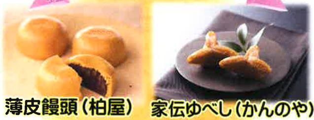
薄皮饅頭(柏屋) 家伝ゆべし(かんのや)